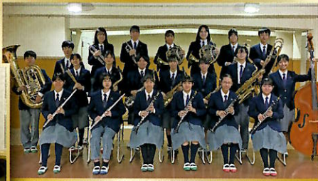
福生市立福生第二中学校吹奏楽部 Fussa City Fussa 2nd Junior High School Wind Ensemble