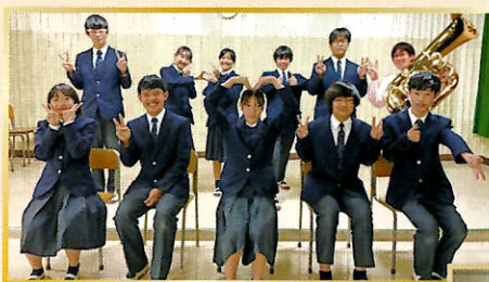
福生市立福生第一中学校吹奏楽部 Fussa City Fussa 1st Junior High School Wind Ensemble

Free of charge with advance application 定員1,000名 Maximum capacity: 1,000