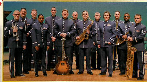
米国防空軍太平洋音楽隊 United States Air Force Band of the Pacific