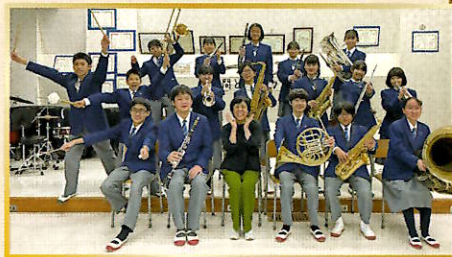
福生市立福生第三中学校吹奏楽部 Fussa City Fussa 3rd Junior High School Wind Ensemble